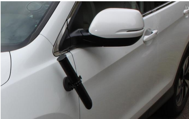
Einfache Montage am Fahrzeug mit Magnethalterung auf metallische Oberfläche.