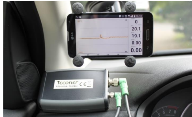
Ein Foto der Benutzeroberfläche mit Temperaturmessungen und das Gehäuse der Bluetooth-Kommunikation im Fahrzeug.